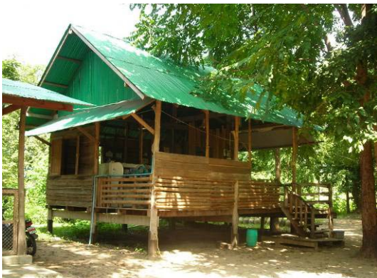
Schulgebäude in Tak

Erklärung des Namens Baan Obun- Haus der