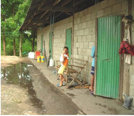
Die Unterkünfte der Kinder und deren Familien