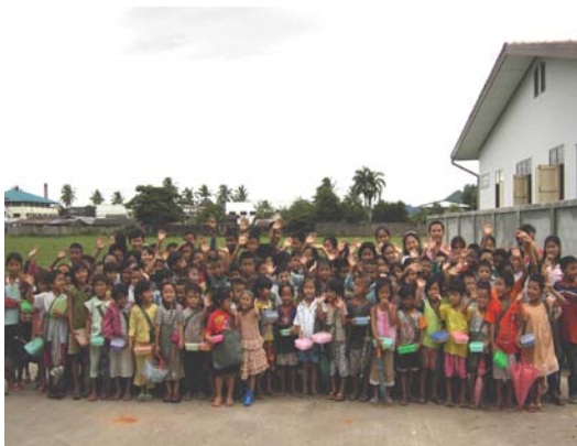
Die Schüler der Mae Sot Baptist School.