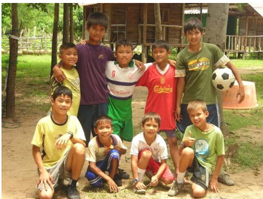
Nach dem Unterricht wird gespielt