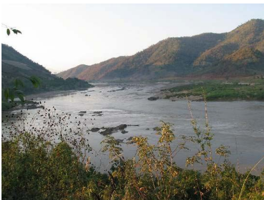
Mekong- der Grenzfluss

Nach Gebeten und Absprachen mit der neuen Gemeinde im Dorf wurde auch hier eine christliche Schule nach dem ACE System gegründet.