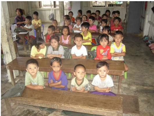
Teilweise müssen zwei Klassen einen Raum teilen.

Zurzeit befinden sich 130 Kinder in der Schule. Die Schule könnte noch mehr Kinder unterrichten, doch fehlen hier die Räumlichkeiten. Teilweise müssen sich zwei Klassen einen Raum teilen. Pastor Josef ist auf der Suche nach einem geeigneten Grundstück.