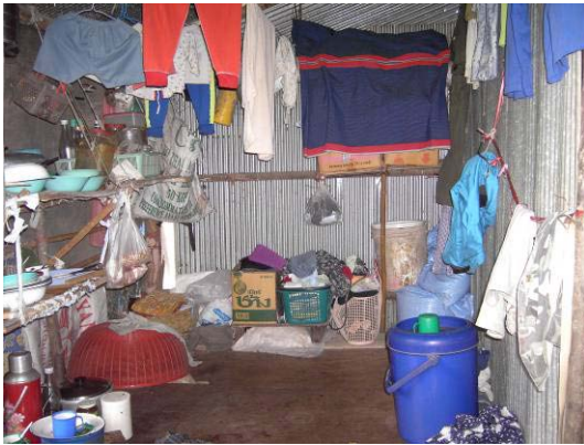
„Wohnung“ in Mae Sot

Der 2. Weltkrieg wurde von den Alliierten gewonnen – die Karen freuten sich auf die Unabhängigkeit. Aber, wie ein Schlag ins Gesicht, gaben die Briten das ganze Land den buddhistischen „Burmanen“. Diese vereinigten alle unabhängigen Länder und gründeten das buddhistische Burma (heute Myanmar). Die christlichen Länder - vor allem die Karen- wollten ihre Unabhängigkeit behalten und so kam es zum Bürgerkrieg. Dieser Krieg hält seit Ende des 2. Weltkrieges an.