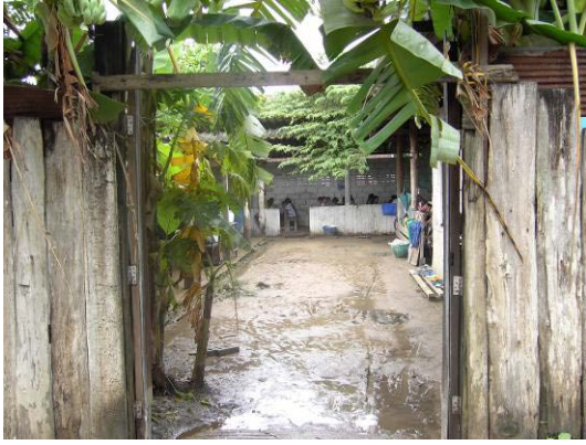
Eingang in die Schule

Verfügung stehen, hat man bereits sehr viel erreichen können. Zunächst einmal sind diese Kinder den größten Teil des Tages nicht in ihrer Slum- Umgebung, wo sie Not und Elend sehen und erleben müssen.