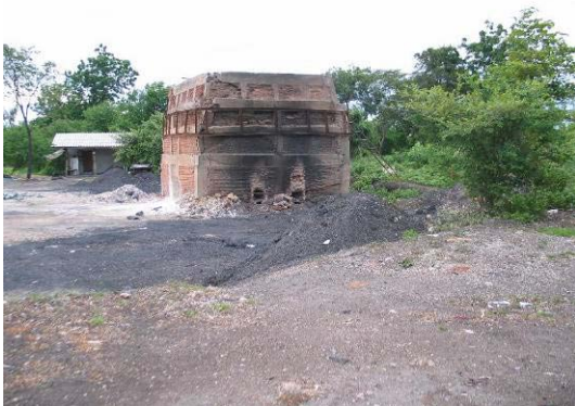
Kalksteinbrennerei und oft Wohngebäude

Die Kinder wohnen ganz in der Nähe des Projektgeländes. Einige leben illegal in Thailand. Das Projekt liegt nur 120 km von der Grenze entfernt. Die Flüchtlinge sind mit einem „Flüchtlingsführer“ zu Fuß den Weg durch den Urwald gelaufen. Einige Familien leben schon viele Jahre hier. Die Kinder sind zum Teil auch hier in Thailand geboren. Sie hatten nie die Chance eine Schule zu besuchen.