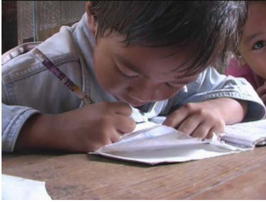
Die Kinder lernen, lesen schreiben und