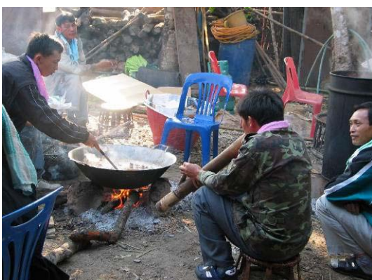
Lebensumstände der Bergvölker