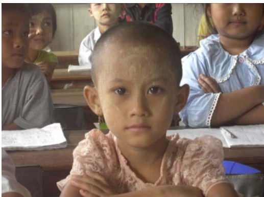
Die Kinder bekommen Liebe, Aufmerksamkeit und Bildung.

in diesem Ort, wo er seit 16 Jahren als Pastor tätig ist und sich vor allem um burmesische Flüchtlinge kümmert.