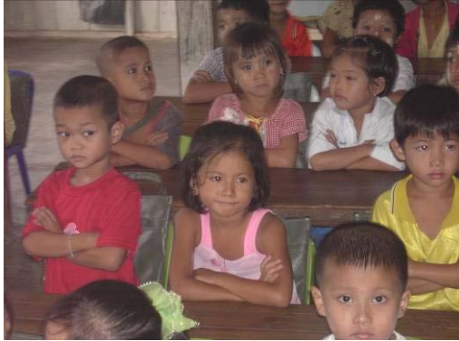
Im thailändischen Schulsystem hätten diese Kinder keine Chance.