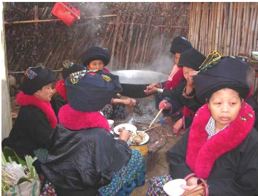
Frauen aus dem Dorf

Das war die Geburtsstunde der Gemeinde am Mekongfluss. Durch das gute Beispiel der Gemeinde und der Segen bringenden Schulausbildung ist das Zeugnis der Christen in den Mien Bergen sehr gestärkt worden.