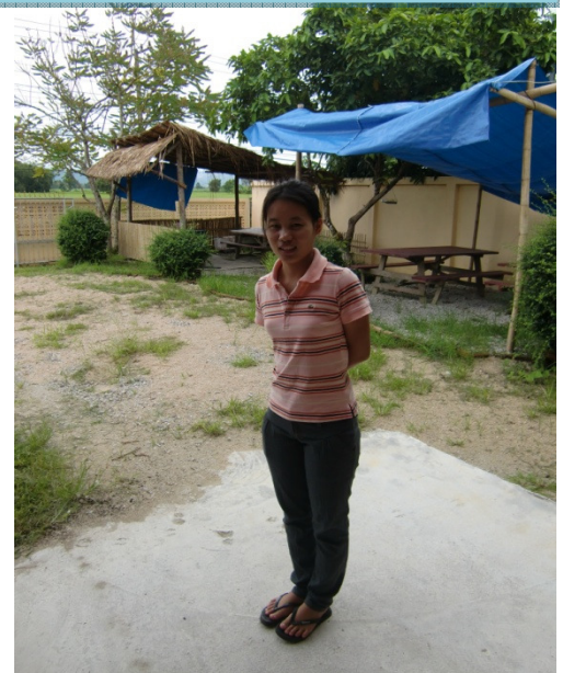
Leiterin des Projekts in Maesot