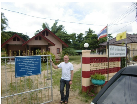
Avoda Learning Center