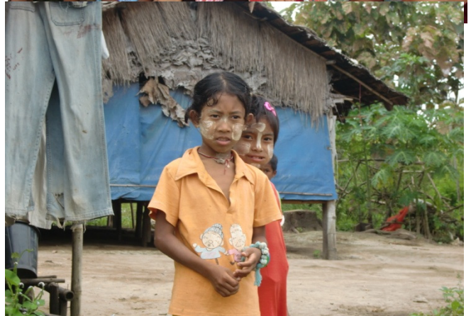
Flüchtlingskinder in Maesot