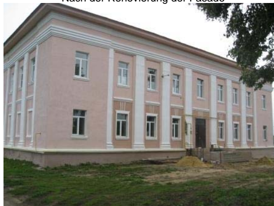
Nach der Renovierung der Fassade