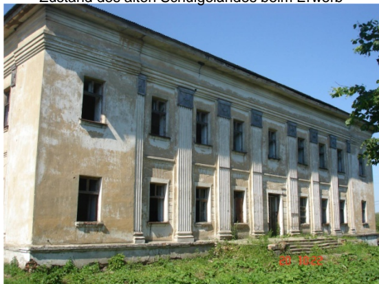
Zustand des alten Schulgeländes beim Erwerb