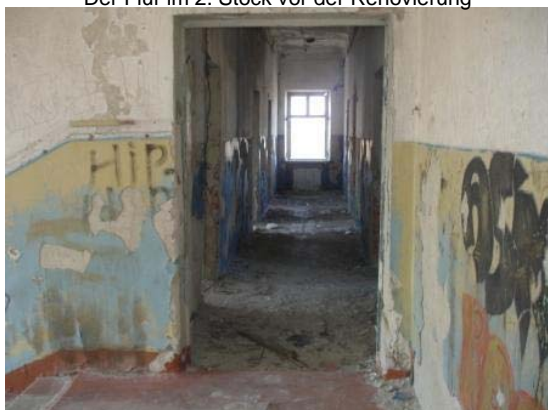
Der Flur im 2. Stock vor der Renovierung