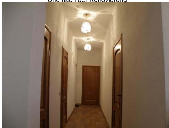
Und nach der Renovierung