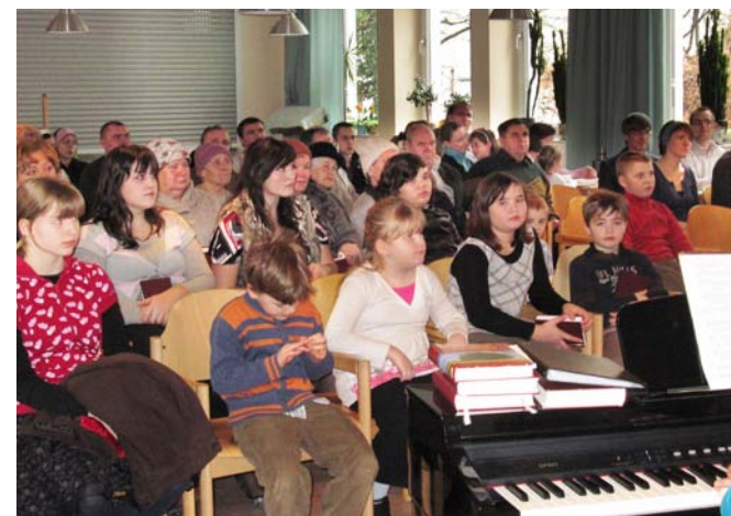
Gemeindegründung in Leipzig